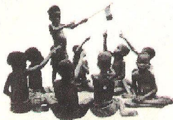
Castaigne, Album, Bruxelles, 1909 [CEC]