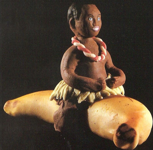
Massepain BELGIQUE 1985

L'exposition en Belgique est une initiative de : Administratie VGC, Adventsaktie Welzijnzorg, Atelier pr. Soc. & Cult., Broederlijk Delen, Confédération Générale d'Enseignement, CNCN, Coopération par l'Education et la Culture, COOPIBO, CSC-Vormingswerk, Culturele Centrale, Ecole sans Racisme, Entraide et Fraternité, FOS, Frères des Hommes, Impressant, ITECO vzw, JDW, Ligue Anti Impérialiste, MRAX, Magasins du Monde, NCOS, Netwerk, OCIV, OXFAM Belgique, R.I. Foyer, Terre Nouvelle, Trefcentrum De Markten, Université de Paix, VIA, Volens, Vredeseilanden, VVKSM-district Bruxelles, Wereldsolidariteit, Wereldwijd, Withuis.