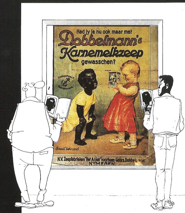
Publicité : HOLLANDE 1910